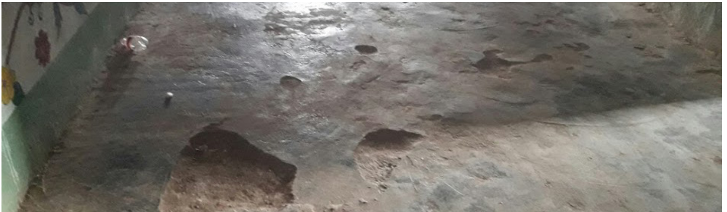
Le sol avant les travaux

Nous remercions l'équipe sur place qui a conduit ce projet dans les temps et dans le budget, outre les avantages cités ci-dessus, le nouveau visage et l'esthétique de l'école aideront les élèves moralement et physiquement.